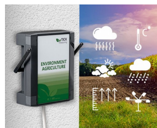
Weather station in agriculture