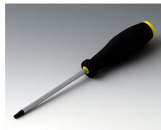
A0399T20 Отвёртка Torx T20